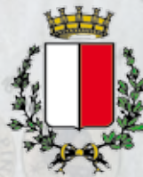
COMUNE DI BARI